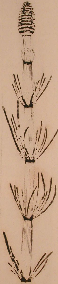
Equisetum limosum Linn.

Mit der Buchdruckerpresse geprägt und gedruckt.