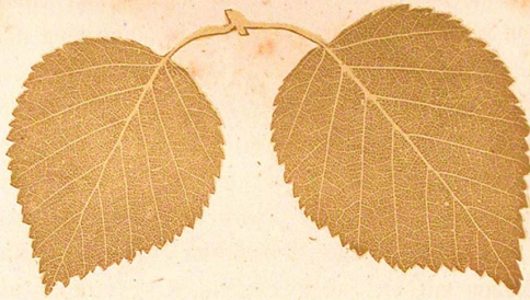
1 Betula odorata , Ruchbirke.